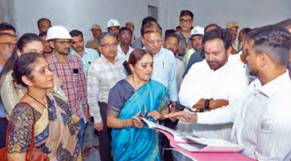
సూతన భవన నిర్మాణ పనుల పూర్తిగలవే అధికారులతో చర్చిస్తున్న కేంద్రమంత్రి కిషన్ రెడ్డి