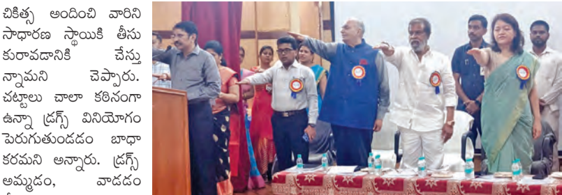
డ్రగ్స్ అమ్మడిని, వాడమని ప్రమాణం చేయిస్తున్న ఆరోగ్యశాఖ మంత్రి దామోదర రాజనల్లిపా

హైదరాబాద్ (సికిందరాబాద్), ఏప్రిల్ 11, ప్రభాతవార్త: డ్రగ్స్ వాడకం వలన వ్యక్తి గత జీవితంతోపాటు సామాజిక జీవితాన్ని కోల్పోతామని, ఉజ్వలమైన భవిష్యత్తు కూడా నాశనమవుతుందని వైద్య, ఆరోగ్య శాఖ మంత్రి దామోదర రాజనల్లి పా అన్నారు. గాంధీ దవాఖాన సైకియాట్రి విభాగంలో 20 వైద్యత్ విద్యార్థులు చేసిన సూతన డ్రగ్స్ డి.ఎడి.క్లస్ కేంద్రాన్ని ఆయన ముఖ్యఅతిథిగా హాజరై ప్రారంభించారు. అనంతరం ఔషధ నియంత్రణ పరిపాలన శాఖ అధ్యక్షులతో జనీవారం గాంధీ మెడికల్ కాలేజీ అలమట్లు ఆడిటోరియంలో ప్రజా పాఠసభలను ప్రజాశాసక కార్యక్రమంలో భాగంగా అలవాటుగా వారి ఔషధ దుర్వినియోగంపై అవగాహనా శిబిరం నిర్వహించారు. ఈ సందర్భంగా ఆయన మాట్లాడుతూ డ్రగ్స్ బారిన పడిన వారి కోసం మాట్లాడుతూ డ్రగ్స్ బారిన పడిన వారి కోసం రాష్ట్రంలో 35 డి.ఎడి.క్లస్ కేంద్రాల ఏర్పాటు చేశామని అన్నారు. వారికి స్ట్రోక్, కొన్ని లింగ్, చికిత్స అందించి వారిని సాధారణ స్థాయికి తీసుకురావడానికి చేస్తున్నామని చెప్పారు. చట్టాలు చాలా కఠినంగా ఉన్నా డ్రగ్స్ వినియోగం పెరుగుతుండడం బాధా కరమని అన్నారు. డ్రగ్స్ అమ్మడం, వాడకం నేరమని వైద్య విద్యార్థుల చేత ప్రతిష్ట చేయించారు. అవగాహన పోస్టర్లను విడుదల చేశారు. వ్యాస రచన పోలీస్ విజేతలకు ప్రశంసాపత్రాలు, బహు మతులను అందజేశారు.