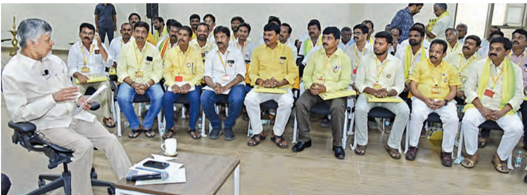
శనివారం డిడిపి కార్యకర్తల శిక్షణ కార్యక్రమంలో పాల్గొన్న సీఎం చంద్రబాబు నాయుడు

విజయవాడ, ఏప్రిల్ 11, ప్రభాతవార్త ప్రతినిధి: పార్టీ కార్యకర్తల ఆర్థిక బలోపేతానికి ఇ3(ఏఐకల్ ఎకనమిక్ ఎంపవర్మెంట్) కార్యక్రమం అమలు చేస్తున్నామని సీఎం చంద్రబాబు తెలిపారు. క్షీన్ ఎన్ఫోర్స్ ఎంకరేజ్ చేస్తూ, క్షీన్ పాలిటిక్స్ కూడా చేస్తున్నామన్నారు. డిడిపిని క్షీన్ పాలిటిక్స్ కేరాఫ్ అడ్రెస్గా నిలిపేలా కార్యకర్తల పనిచేయాలని సూచించారు. పాజిటివ్ పాలిటిక్స్ చేయాలని, పాజిటివ్ ఓట్లు పెంచుకోవాలన్నారు. ప్రభుత్వం పడుతున్న కష్టాన్ని కూడా ప్రజలకు అర్థమయ్యేలా చెప్పాలని పార్టీ నేతలు, కార్యకర్తల కోసం ఈ3 కార్యక్రమం తీసుకోవాలని సీఎం చంద్రబాబు అన్నారు. ఎన్టీఆర్ భవన్లో శిక్షణ తీసుకుంటున్న నేతలు, కార్యకర్తలతో సీఎం చంద్రబాబు కఫీ తాగుతూ ముచ్చటించారు. వారికి పలు సూచనలు