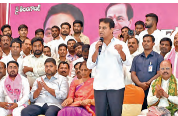
బిఆర్ఎస్ ప్రజాప్రతినిధుల సన్మాన కార్యక్రమంలో మాట్లాడుతున్న బిఆర్ఎస్ పర్లొంగ్ ప్రెసిడెంట్ కెటిఆర్