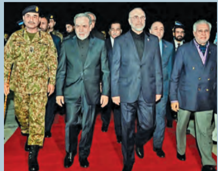
చర్యలకోసం పాక్ వచ్చిన ఇరాన్ ప్రతినిధుల బృందం

ఇస్లామాబాద్లో 'అమెరికా, ఇరాన్ మధ్య తొలిరోజు నాలుగు గంటలు చర్చలు పాక్ ప్రధాని షేహబాజ్ షరీఫ్ మధ్యవర్తిత్వం స్తంభించిన ఆస్తులు, నిధులు విడుదల చేయాలని ఇరాన్ డిమాండ్ కొత్త షరతులతో ముందుకు సాగని చర్చలు హార్డుకోపై కొనసాగుతున్న ప్రతిష్టంభన