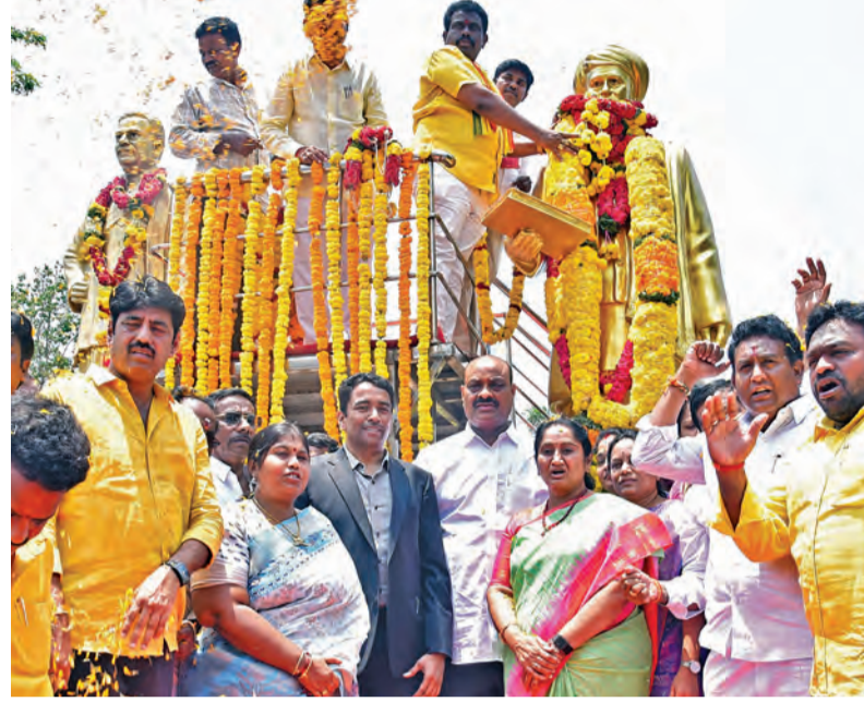
శనివారం మహాత్మా జ్యోతిబా ఫూలే జయంతినందంగా ఆయన విగ్రహానికి నివాళి అర్పిస్తున్న మంత్రులు