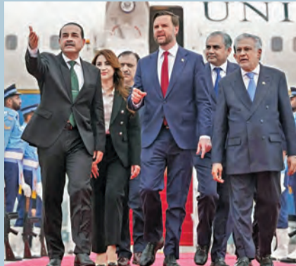
శనివారం ఇస్లామాబాద్ చేరుకున్న జెడిఎస్ బృందం ఇస్లామాబాద్, ఏప్రిల్ 11: ఇరాన్ సై యుద్ధం ముగింపు కోసం అమెరికా, ఇరాన్ దేశాలమధ్య జరుగుతున్న శాంతి చర్చల్లో పురోగతి కనిపించకపోయినా ఒకరి డిమాండ్ వార్డర్ మరొకరు పంచుకున్నారు. >>2

ఇస్లామాబాద్లో 'అమెరికా, ఇరాన్ మధ్య తొలిరోజు నాలుగు గంటలు చర్చలు పాక్ ప్రధాని షేహబాజ్ షరీఫ్ మధ్యవర్తిత్వం స్తంభించిన ఆస్తులు, నిధులు విడుదల చేయాలని ఇరాన్ డిమాండ్ కొత్త షరతులతో ముందుకు సాగని చర్చలు హార్డుకోపై కొనసాగుతున్న ప్రతిష్టంభన